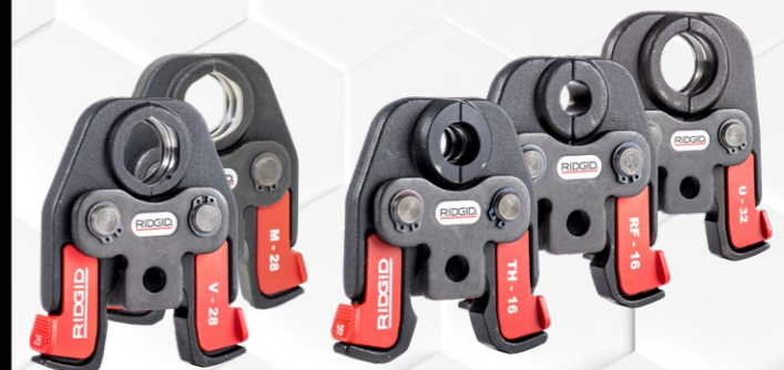
M - V 12 - 35 mm