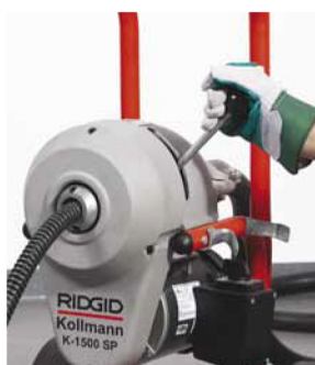
Zatažení páky spojky roztočí spirálu