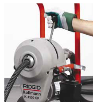
Uvolněním páky se spirála okamžitě zastaví