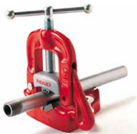
Stolní třmenový svěřák