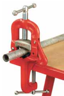
Přenosná souprava třmenového svěřáku