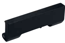
Přídavné plastové čelisti